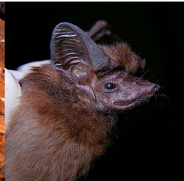
3 Peropteryx kappleri EMBALLONURIDAE