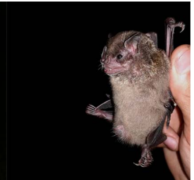
24 Sturnira oporaphilum PHYLLOSTOMIDAE