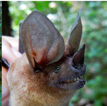
18 Lophostoma brasiliense PHYLLOSTOMIDAE