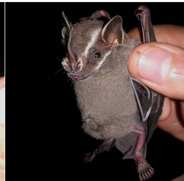
27 Uroderma bilobatum PHYLLOSTOMIDAE