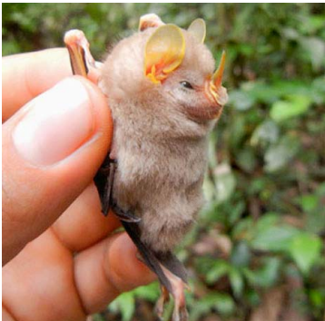
21 Mesophylla macconnelli PHYLLOSTOMIDAE