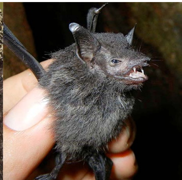
6 Saccopteryx bilineata EMBALLONURIDAE