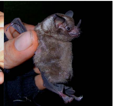
12 Carollia brevicauda PHYLLOSTOMIDAE