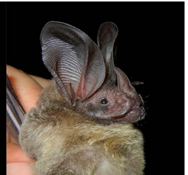
20 Lophostoma silvicolum PHYLLOSTOMIDAE