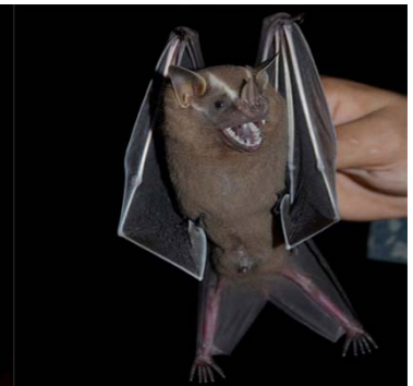
8 Artibeus lituratus PHYLLOSTOMIDAE