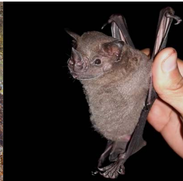
10 Artibeus planirostris PHYLLOSTOMIDAE