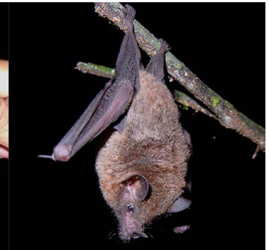
16 Glossophaga soricina PHYLLOSTOMIDAE