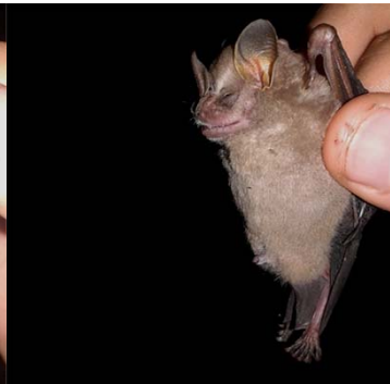
14 Dermanura glauca PHYLLOSTOMIDAE