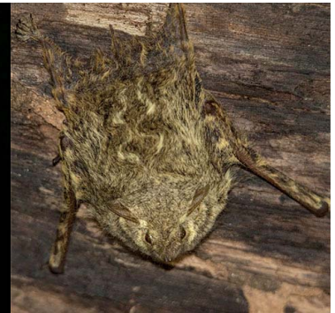
4 Rhynchonycteris naso EMBALLONURIDAE