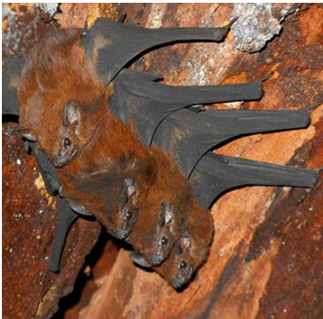
1 Cormura brevirostris EMBALLONURIDAE