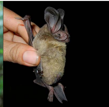
19 Lophostoma silvicolum PHYLLOSTOMIDAE