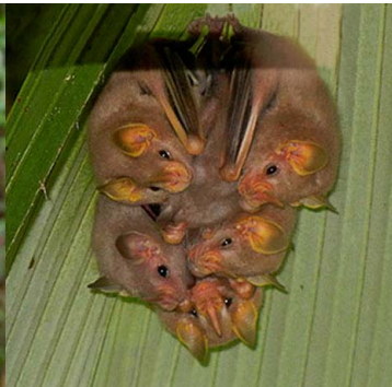
22 Mesophylla macconnelli PHYLLOSTOMIDAE