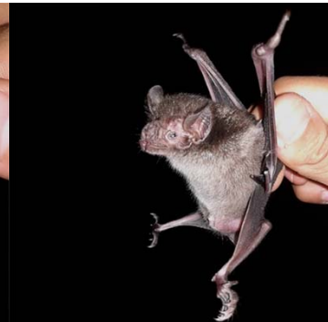
15 Desmodus rotundus PHYLLOSTOMIDAE