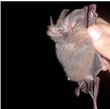
25 Trachops cirrhosus PHYLLOSTOMIDAE