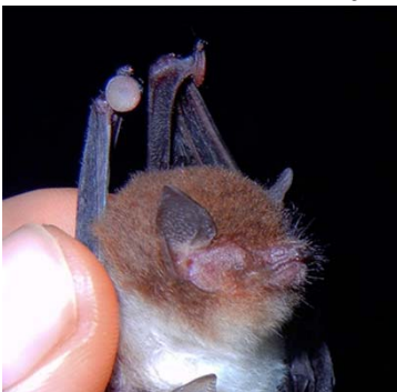
29 Thyroptera tricolor THYOPTERIDAE