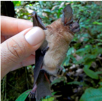
17 Lophostoma brasiliense PHYLLOSTOMIDAE

[fieldguides.fieldmuseum.org] [886] version 1 05/2017