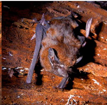
2 Peropteryx kappleri EMBALLONURIDAE