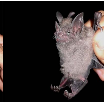
11 Carollia benkeithi PHYLLOSTOMIDAE