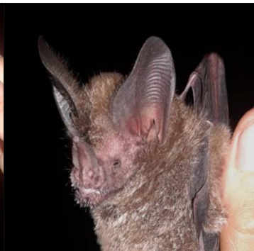
26 Trachops cirrhosus PHYLLOSTOMIDAE