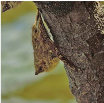
5 Rhynchonycteris naso EMBALLONURIDAE