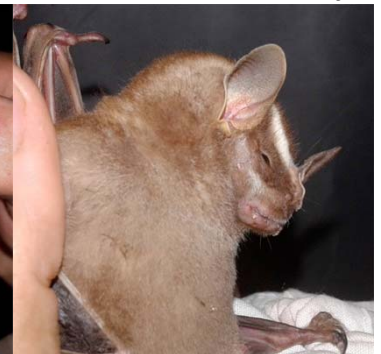
28 Vampyroides caraccioli PHYLLOSTOMIDAE