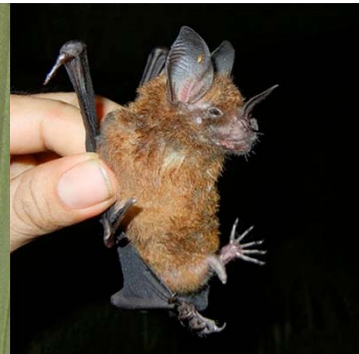
23 Phyllostomus elongatus PHYLLOSTOMIDAE