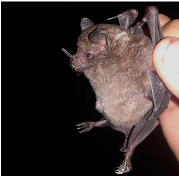
13 Carollia perspicillata PHYLLOSTOMIDAE