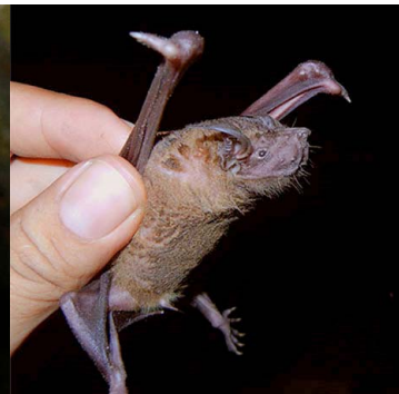
7 Noctilio albiventris NOCTILIONIDAE