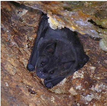
9 Artibeus obscurus PHYLLOSTOMIDAE